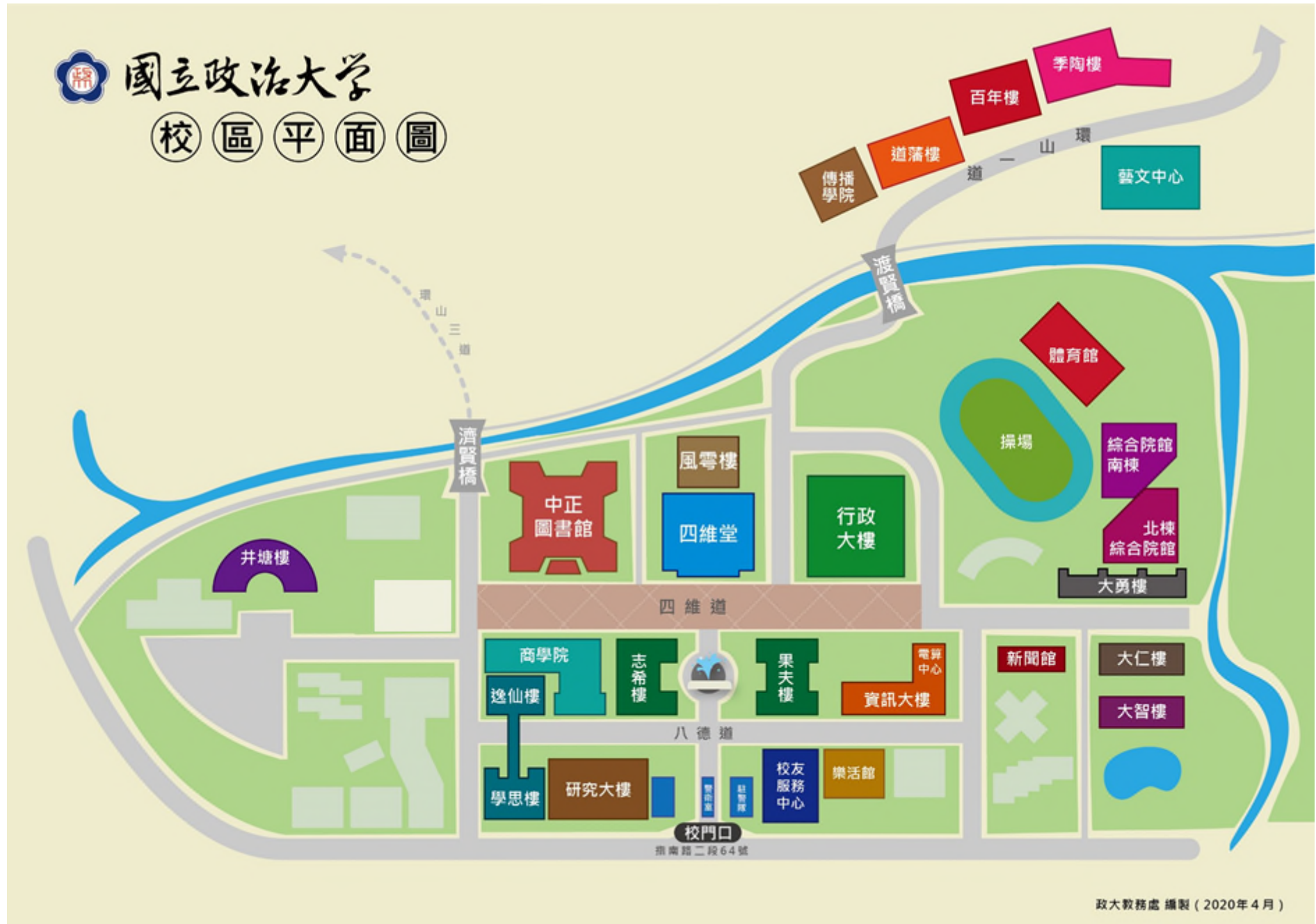
國立政治大學主要建築位置暨週邊道路圖 (校址：116011 臺北市文山區指南路二段 64 號)